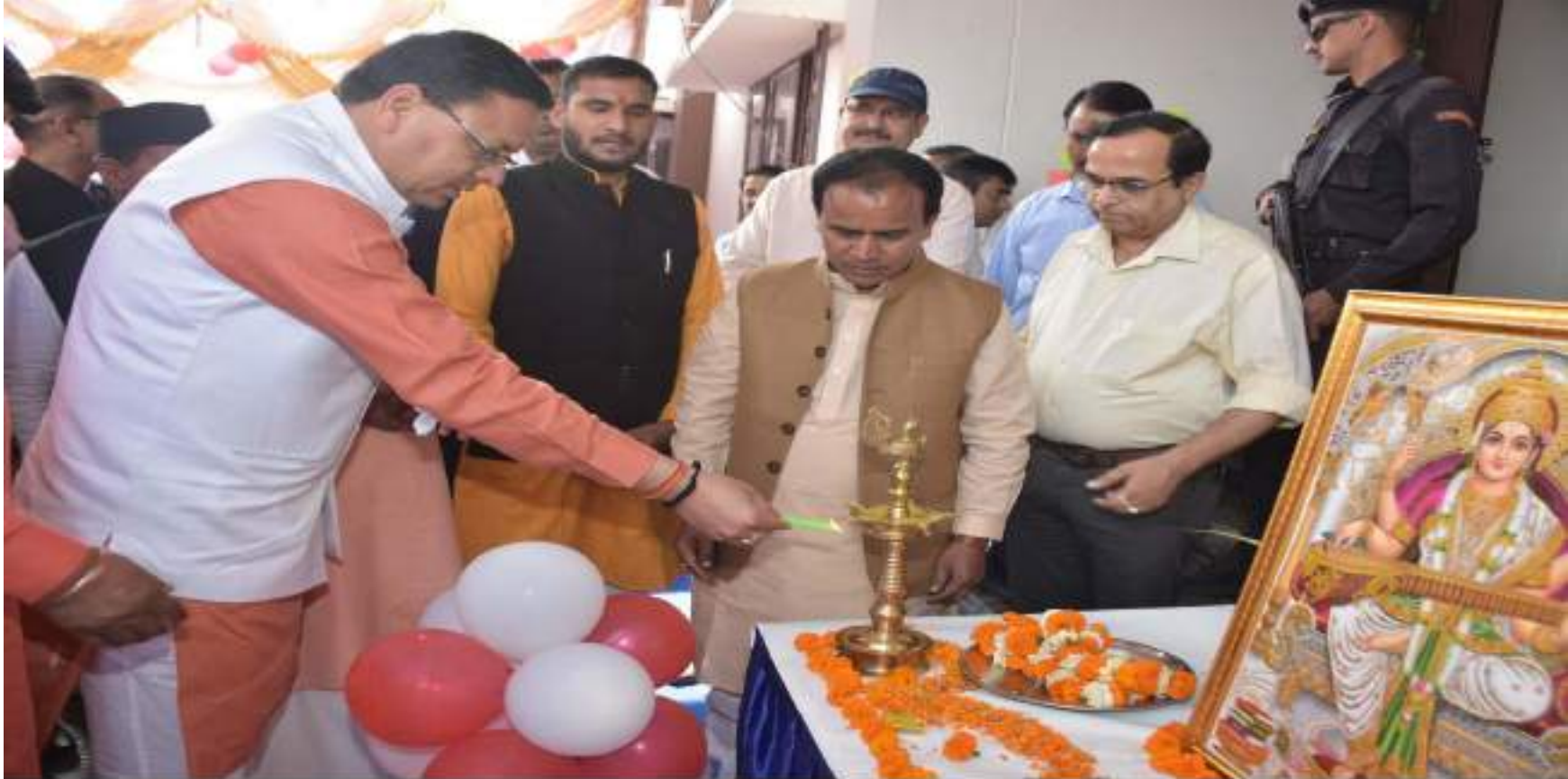
नेताजी सुभाष चन्द्र बोस आवासीय विद्यालय बनियावाला, देहरादून में शिक्षा विभाग द्वारा आयोजित "प्रवेशोत्सव" कार्यक्रम का दीप प्रज्वलित कर कार्यक्रम का शुभारम्भ करते हुए मुख्यमंत्री श्री मुकुल सिंह धामी । दिनांक 11 अप्रैल, 2023