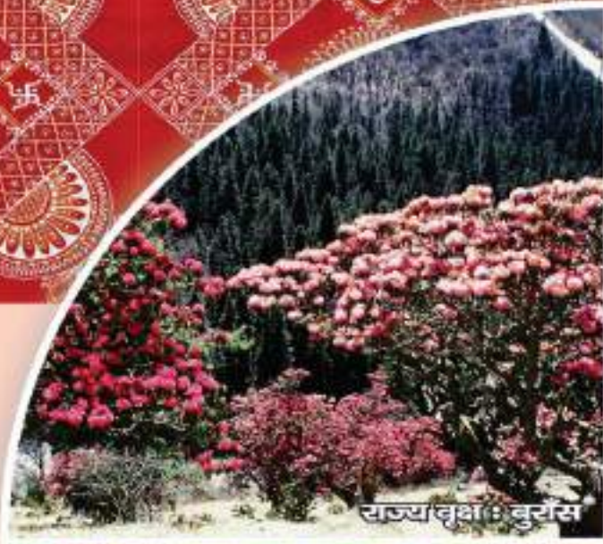
राज्य वृक्ष : वुर्सस