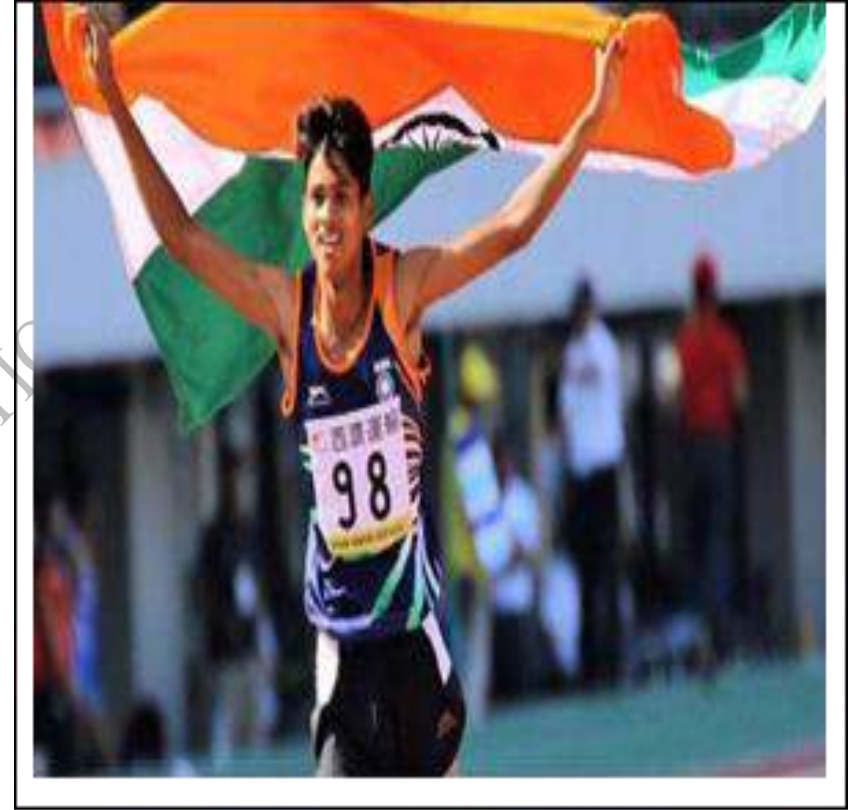
एशियन जूनियर एथलेटिक्स चैम्पियनशिप, 2018