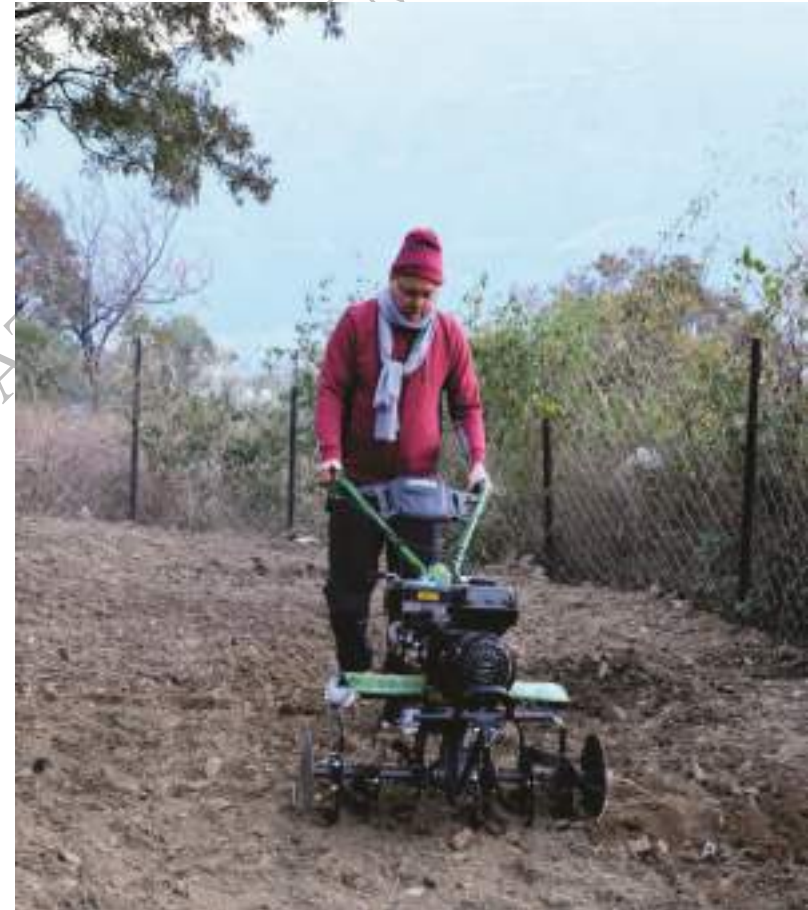
जनपद टिहरी में मा0 मुख्यमंत्री जी पॉवर वीडर (आधुनिक कृषि यंत्र) के माध्यम से खेत की जुताई करते हुए