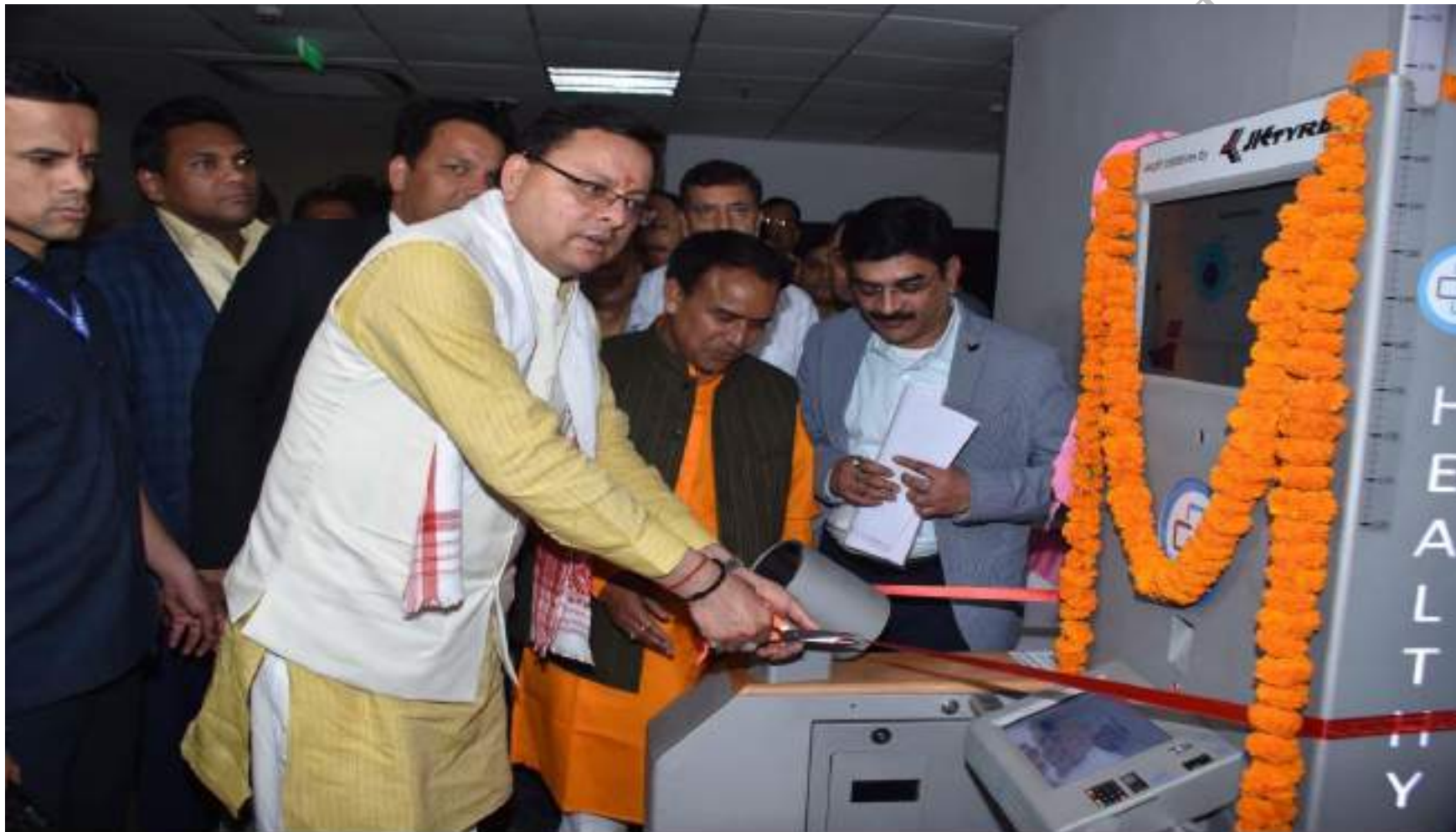
मुख्यमंत्री श्री पुष्कर सिंह धामी ने गुरुवार को सचिवालय में जे के टायर लिमिटेड कम्पनी तथा यस बैंक द्वारा सीएसआर के तहत लगाये गये हेल्थ एटीएम का लोकार्पण किया। दिनांक 06 अप्रैल, 2023