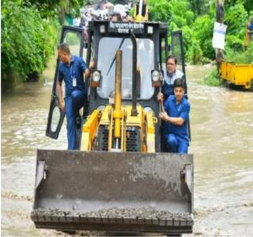
उत्तराखण्ड में बादल फटने के कारण आई बाढ़ का दौरा करते मा0 मुख्यमंत्री, उत्तराखण्ड