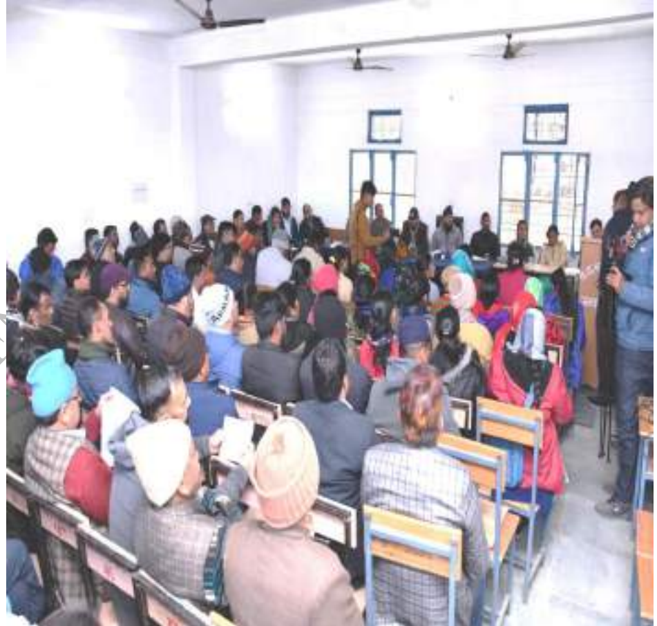
सुदूर क्षेत्र विकास खण्ड देवाल के घेस ग्राम पंचायत में बीडीसी की बैठक का आयोजन