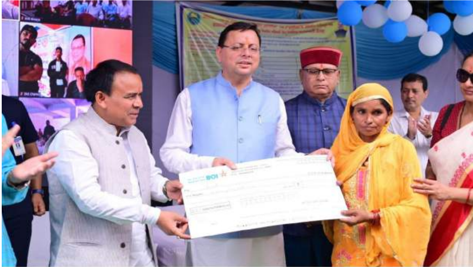
मुख्यमंत्री श्री पुष्कर सिंह घामी ने राजकीय बालिका इंटर कॉलेज राजपुर रोड, देहरादून में अभिकों की पुत्रियों का विवाह उपरांत आर्थिक सहायता के चेक प्रदान किये। दिनांक 16 सितंबर 2023