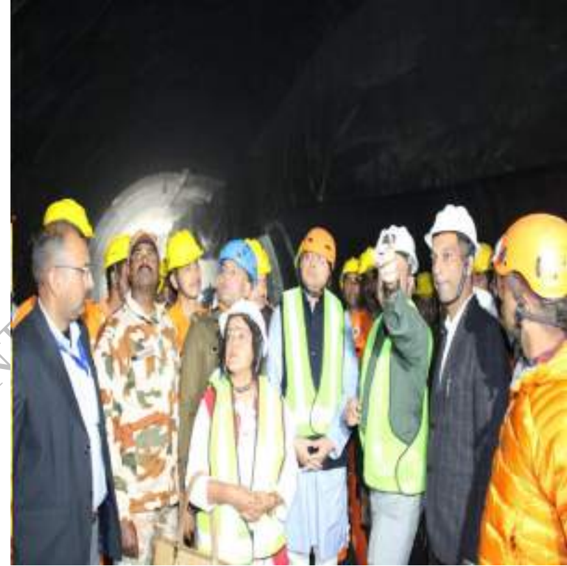
सिलक्यारा, उत्तरकाशी सुरंग में फंसे मजदूरों की जानकारी लेते हुए मा0 मुख्यमंत्री, उत्तराखण्ड