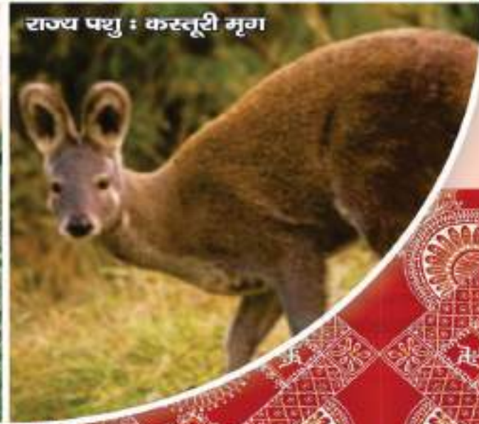
राज्य पशु : कस्तूरी मृग