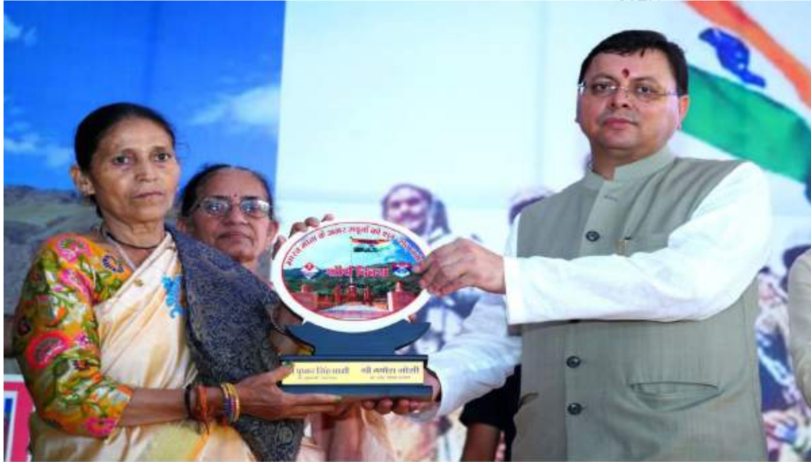
कारगिल विजय दिवस (शौर्य दिवस) पर गांधी पार्क में आयोजित कार्यक्रम में शहीदों के परिवारजनों को सम्मानित करते हुये मुख्यमंत्री श्री पुष्कर सिंह धामी । दिनांक 28 जुलाई, 2023