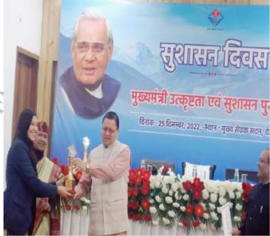
मुख्यमंत्री उत्कृष्टता एवं सुशासन पुरस्कार वितरण समारोह वर्ष 2022