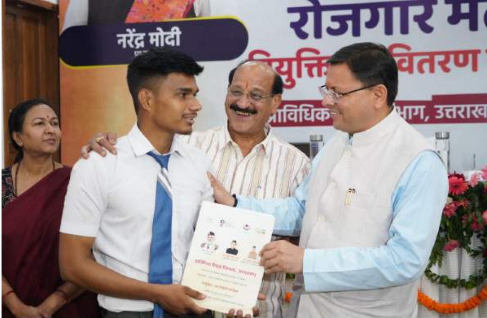
प्राविधिक शिक्षा विभाग द्वारा आयोजित कार्यक्रम में अभ्यर्थियों को नियुक्ति पत्र प्रदान करते हुए मुख्यमंत्री श्री पुष्कर सिंह धामी । दिनांक 05 जून, 2023