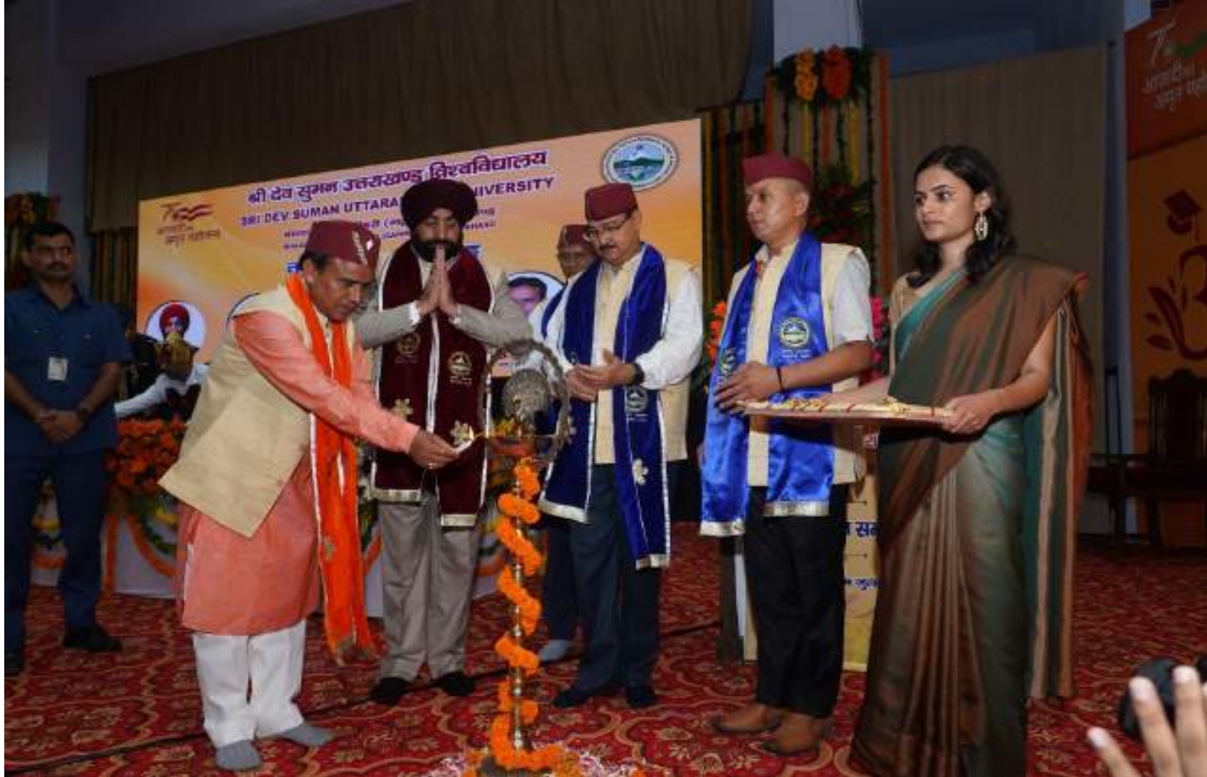
श्रीदेव सुमन उत्तराखण्ड विश्वविद्यालय का दीक्षांत समारोह कार्यक्रम।