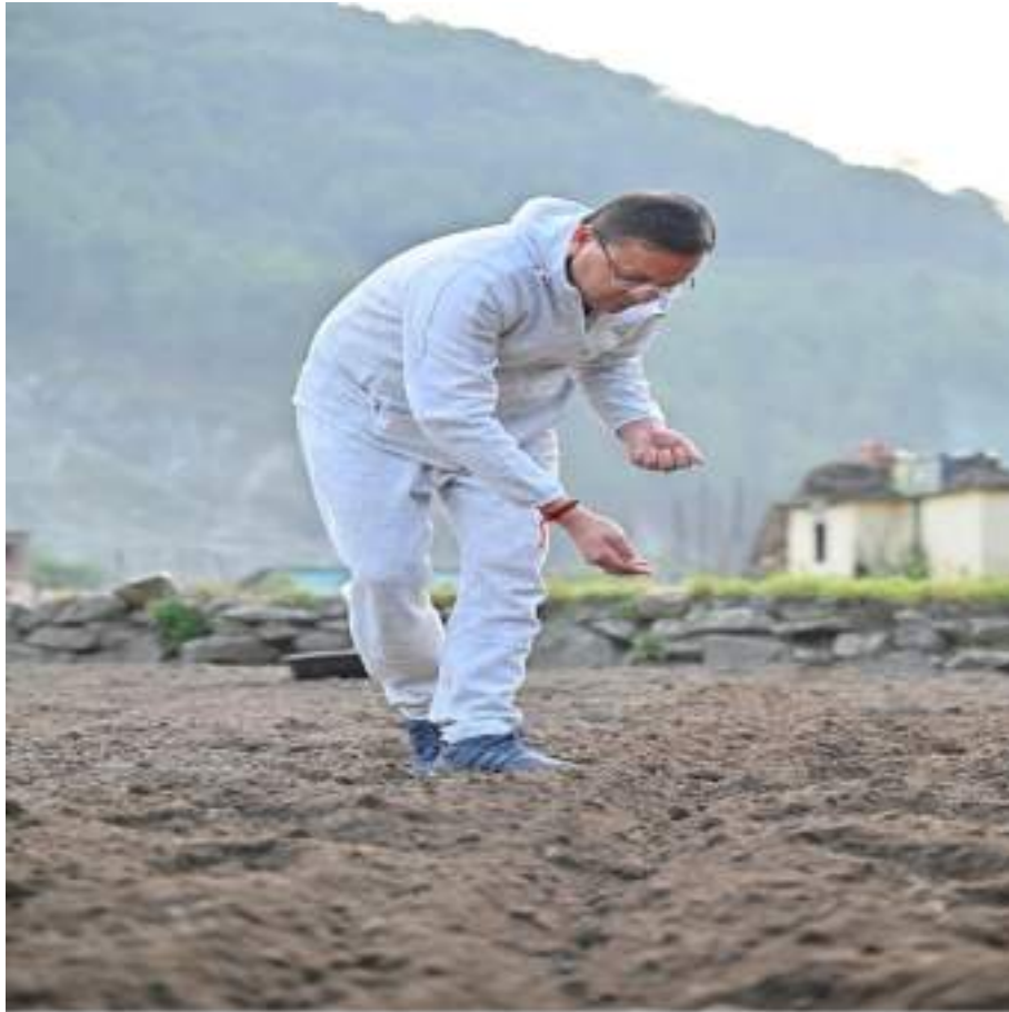
गांव क्षेत्र में मंडुवे की खेती को बढ़ावा देने के मकसद से घाम सिरोर में 'लाइन सोइंग' विधि से मंडुआ की बोआई करते हुए मुख्यमंत्री श्री पुष्कर सिंह धामी। दिनांक 11 जून, 2023