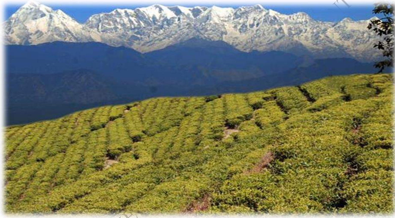
चाय बागान कौशानी, बागेश्वर