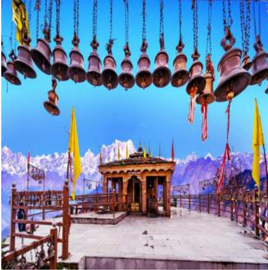
कार्तिक स्वामी मंदिर, जनपद-रुद्रप्रयाग