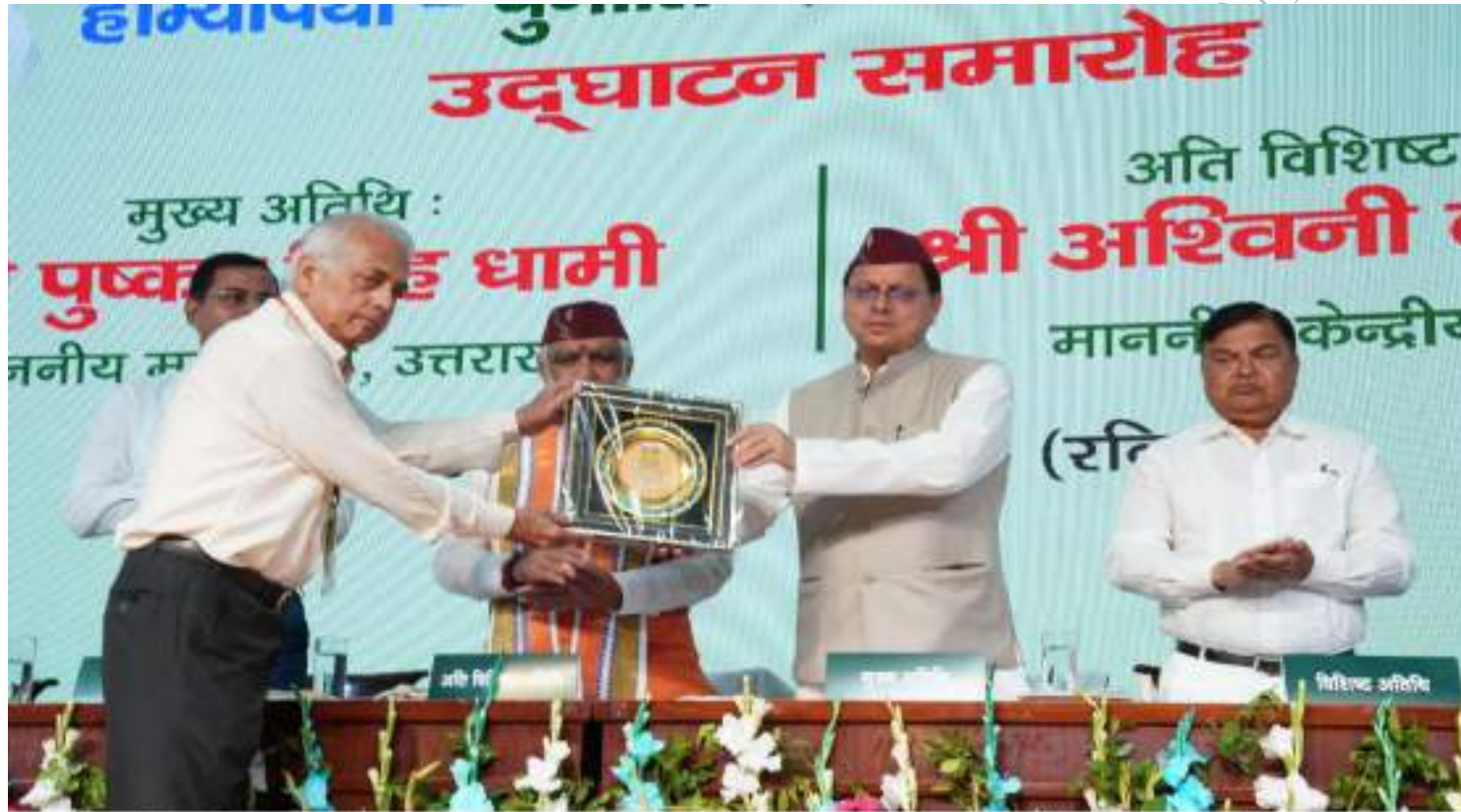
दून विश्वविद्यालय, देहरादून में राष्ट्रीय होम्योपैथिक सम्मेलन 'होम्योकॉन- 2023' के शुभारम्भ अवसर पर मुख्यमंत्री श्री पुष्कर सिंह धामी। दिनांक 14 मई, 2023