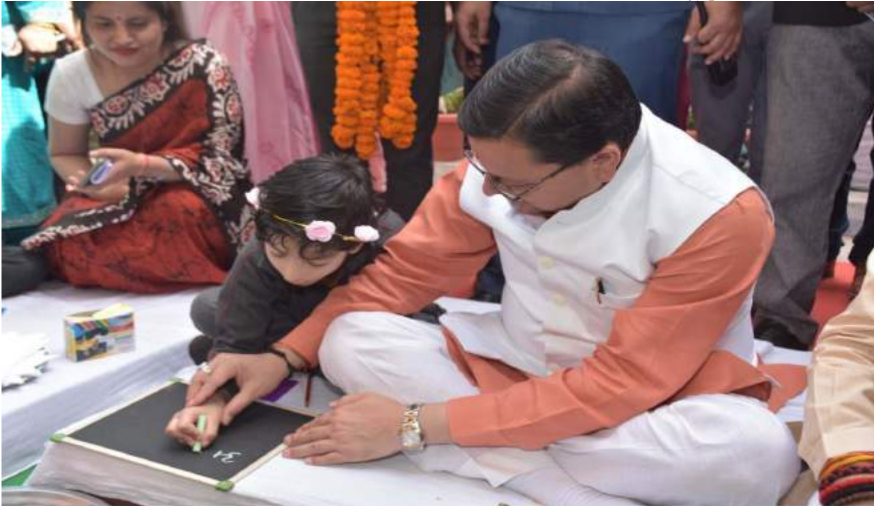
नेताजी सुभाष चन्द्र बोस आवासीय विद्यालय बनियावाला, देहरादून में शिक्षा विभाग द्वारा आयोजित "प्रवेशोत्सव" कार्यक्रम के अवसर पर मुख्यमंत्री श्री पुष्कर सिंह धामी। दिनांक 11 अप्रैल, 2023