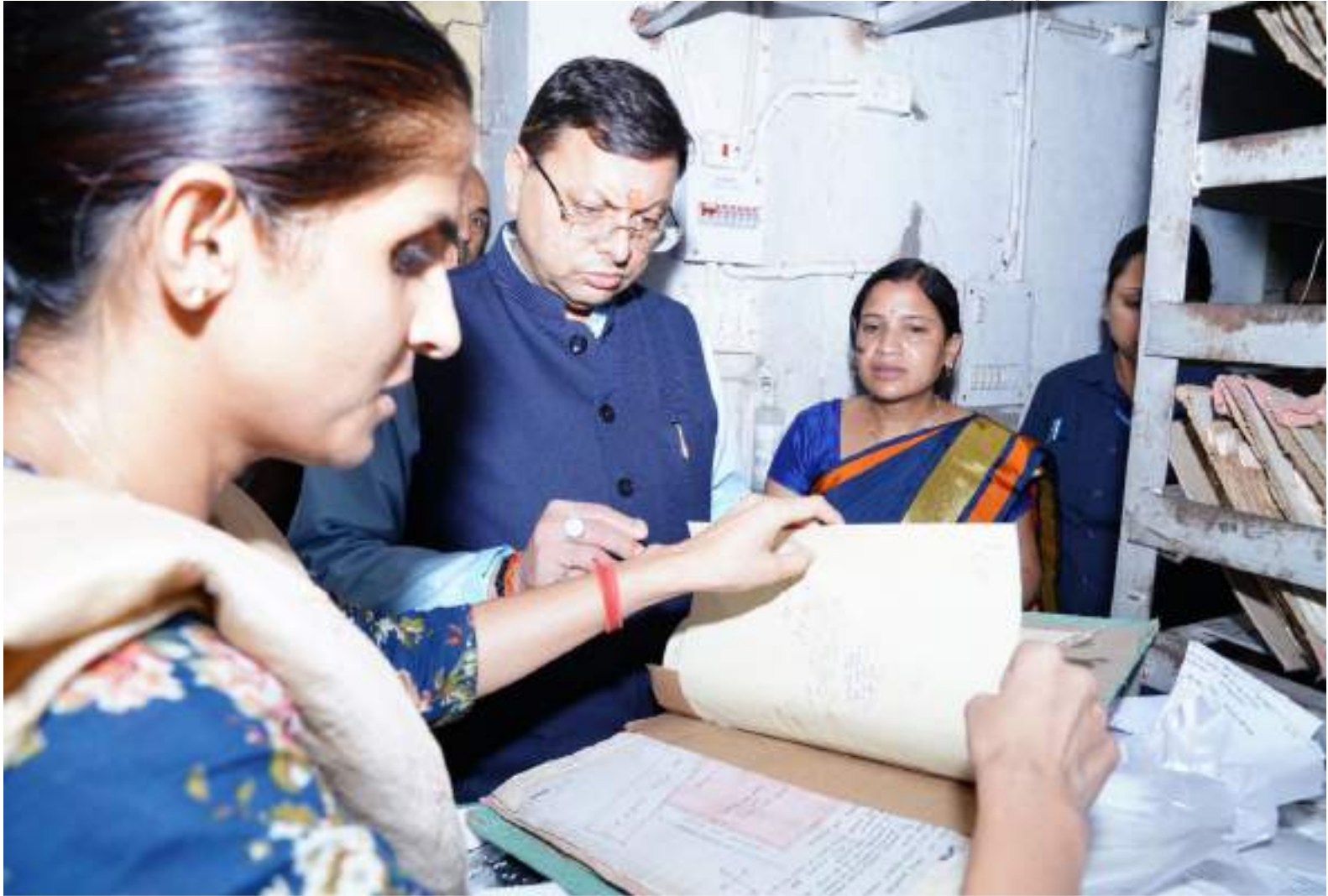
मुख्यमंत्री श्री पुष्कर सिंह धामी ने बगियाद से रोहतासूल कलेक्ट्रेट स्थित रजिस्ट्रार ऑफिस का औद्योगिक निरीक्षण किया। दिनांक 15 जुलाई 2023