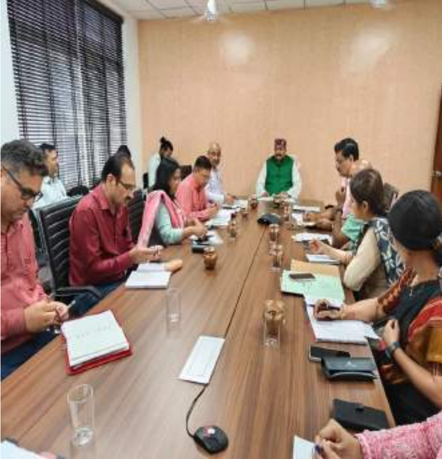
दिनांक 22 अगस्त 23 को पंचायतीराज विभाग की समीक्षा बैठक ।