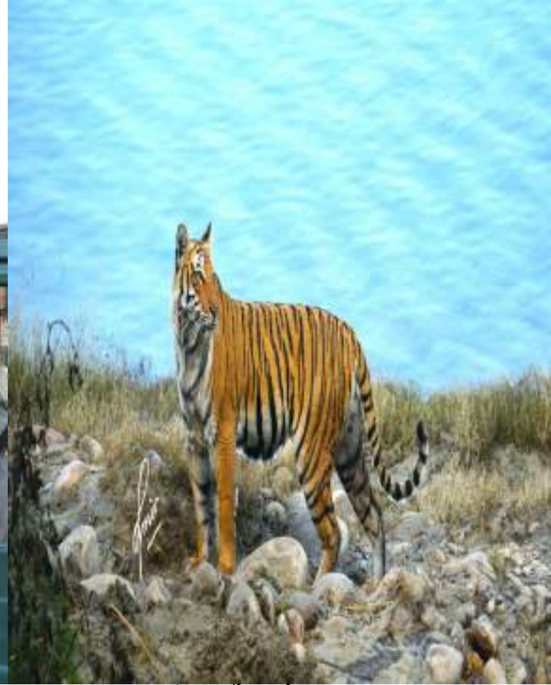
जिम कार्बेट पार्क