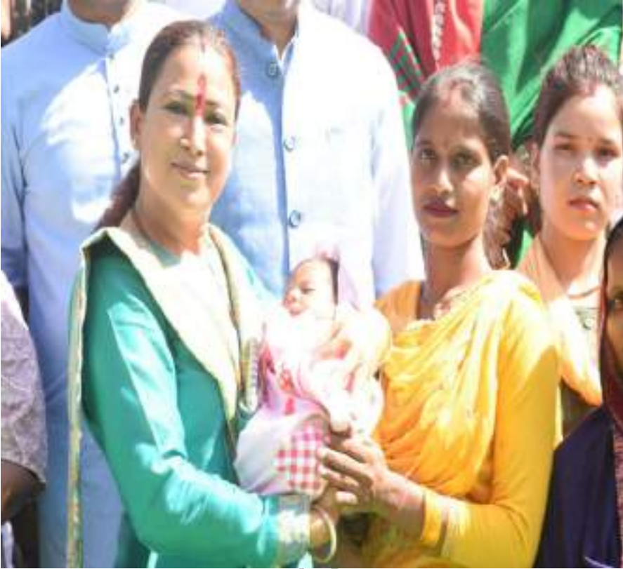
जनपद नैनीताल के रामनगर में गोदभराई कार्यक्रम में मा0 मंत्री जी