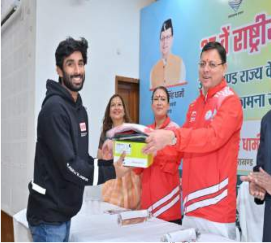
37वें गोवा राष्ट्रीय खेलों में हिस्सा लेने जा रहे खिलाड़ियों को खेल किट प्रदान करते हुए मा10 मुख्यमंत्री, उत्तराखण्ड