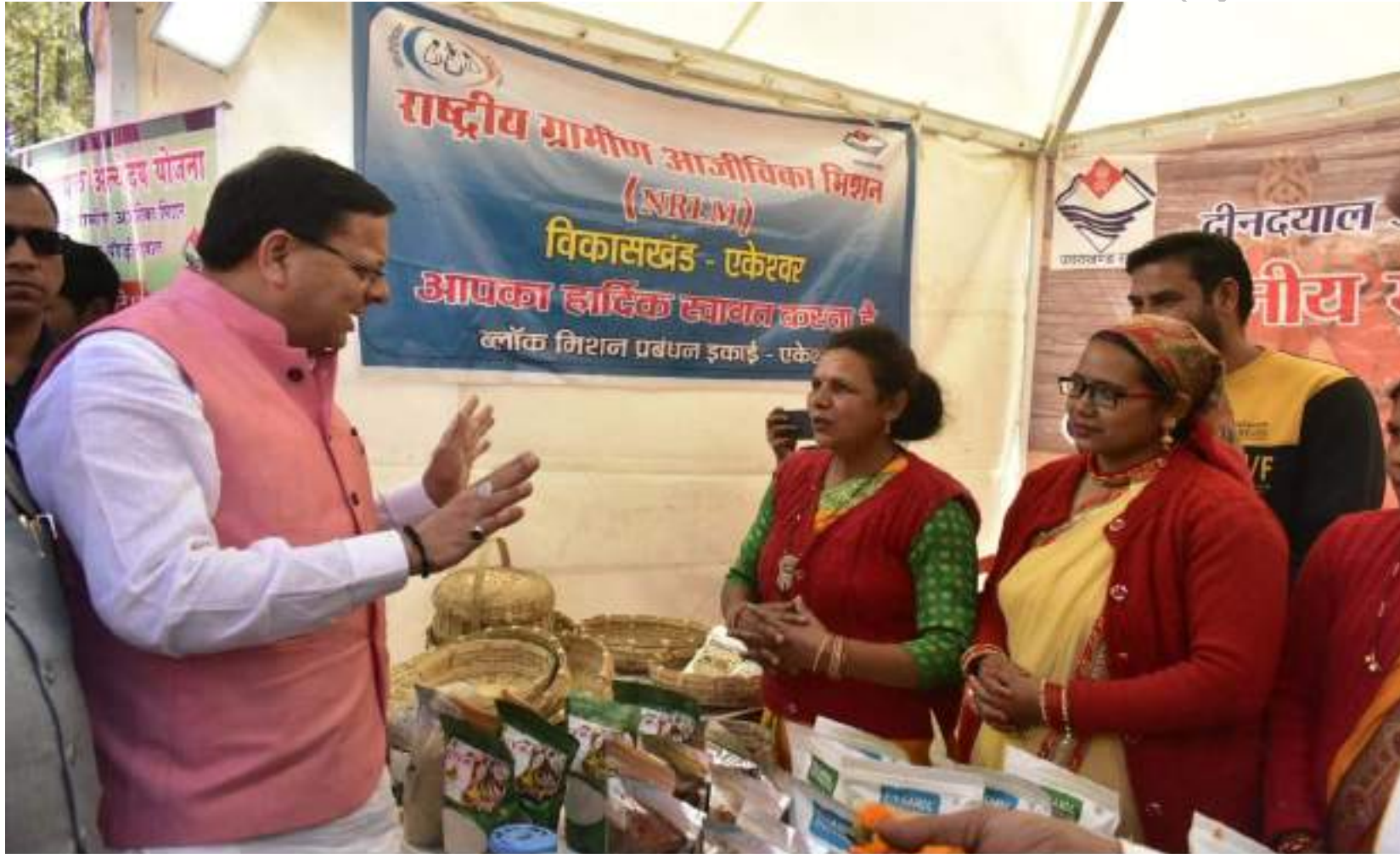
चौबट्टाखाल में आयोजित कार्यक्रम में विभिन्न विभागों द्वारा लगाये गये स्टॉलों का अवलोकन करते हुए मुख्यमंत्री श्री पुष्कर सिंह धामी। दिनांक 07 अप्रैल, 2023