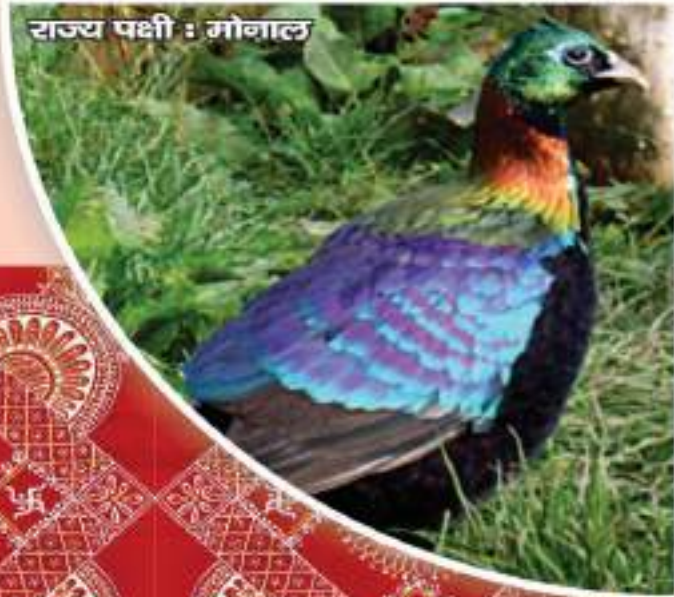
राज्य पक्षी : मोनाल