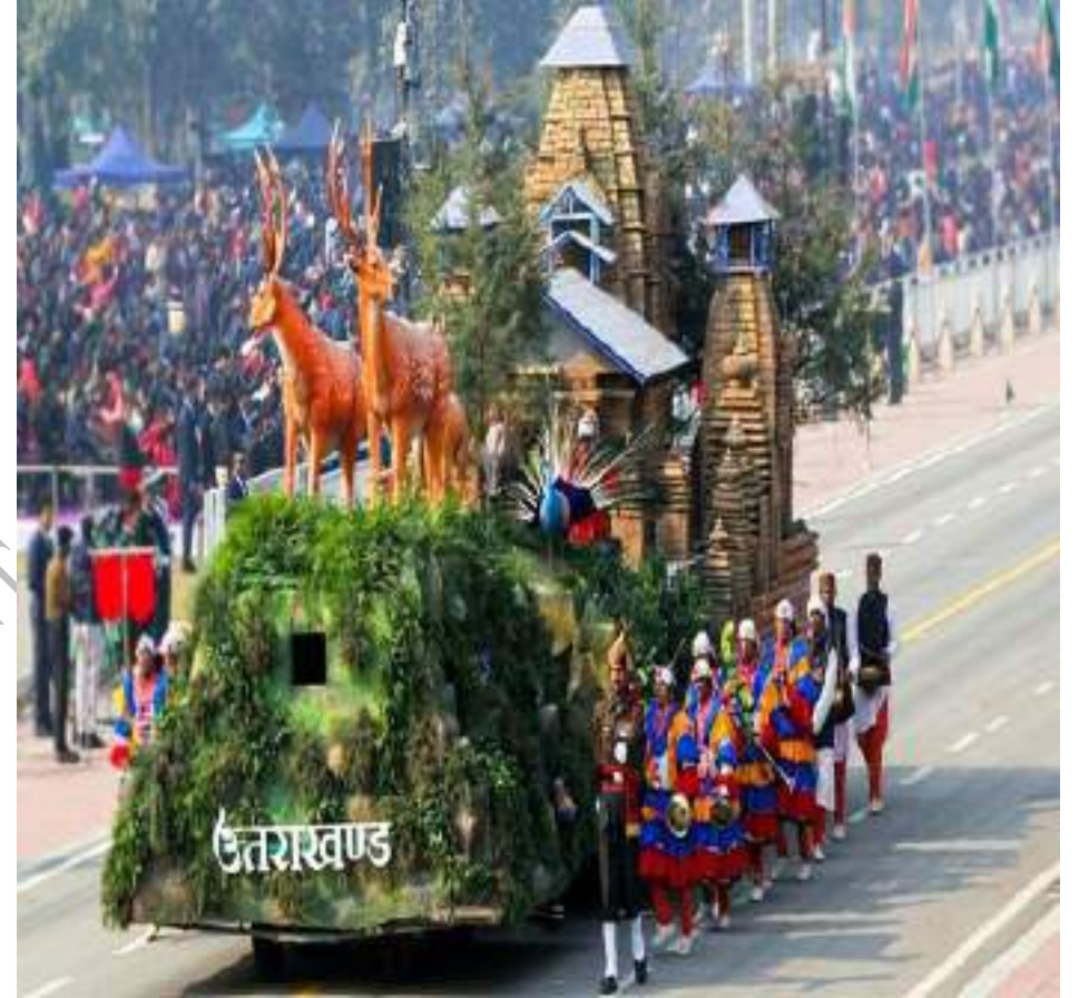
वर्ष 2023 में गणतंत्र दिवस परेड में पाया पहला स्थान-मानसखण्ड झांकी, उत्तराखण्ड