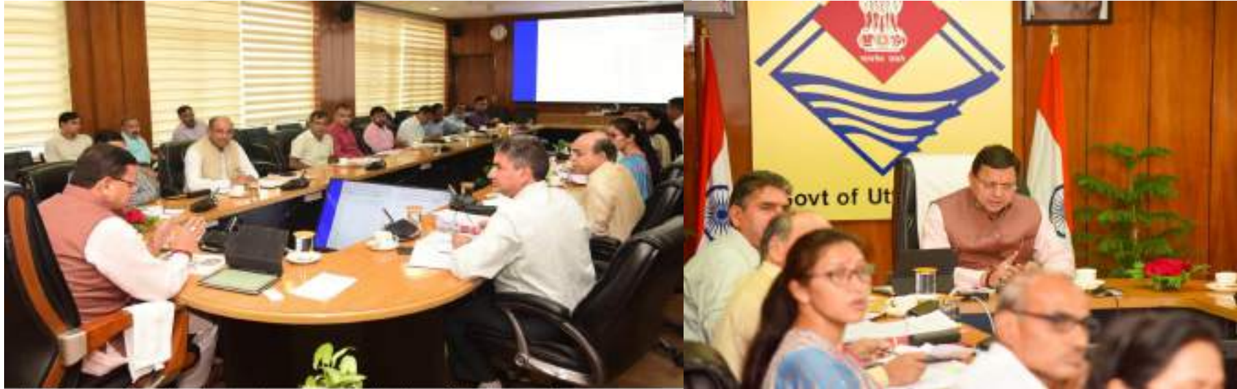
कार्यक्रम क्रियान्वयन विभाग की पहली समीक्षा बैठक लेते हुए मुख्यमंत्री श्री पुष्कर सिंह धामी। दिनांक 09 जून, 2023

“इस पुस्तक को प्रकाशित करने का मुख्य उद्देश्य, पात्र लाभार्थियों को जनकल्याणकारी, स्वरोजगार/रोजगारपरक, कौशल विकास/प्रशिक्षणपरक, निवेशपरक योजनाओं का लाभ पहुंचाने की प्रक्रिया को सरल शब्दों में अवगत कराना है, जिससे पात्र लाभार्थी योजनाओं का लाभ प्राप्त कर सकें और हमारा उत्तराखण्ड “सर्वश्रेष्ठ उत्तराखण्ड” बन सके।” प्रथम बार, इस प्रकार की पुस्तक बनाने का समग्र प्रयास किया गया है। यह पुस्तक जहां पात्र लाभार्थी को योजनाओं का लाभ प्राप्त करने में सहयोग करेगी वहीं नीतिनिर्धारणकर्ताओं, शोधकर्ताओं, पाठकों के लिए रूचिकर एवं सरकार द्वारा किये जा रहे प्रयासों के प्रति सजग बनायेगी। इस पुस्तक में संशोधन/सुधार/सुझाव/आपत्ति हेतु कृपया निम्न पते/ईमेल में प्रेषित करना चाहें ताकि आगामी संस्करण को सुधारों के साथ प्रस्तुत किया जा सके।”