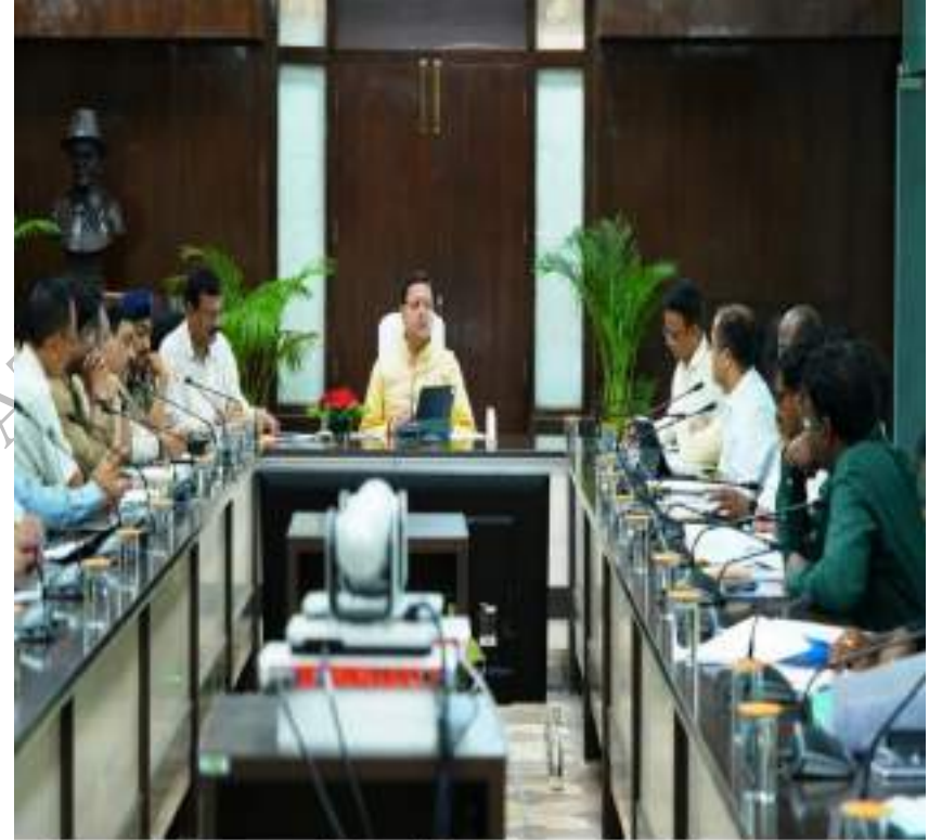
सचिवालय में सीएन डेवलाइन-1905 की समीक्षा करते हुये मुख्यमंत्री श्री पुष्कर सिंह धामी। दिनांक 27 जुलाई, 2023